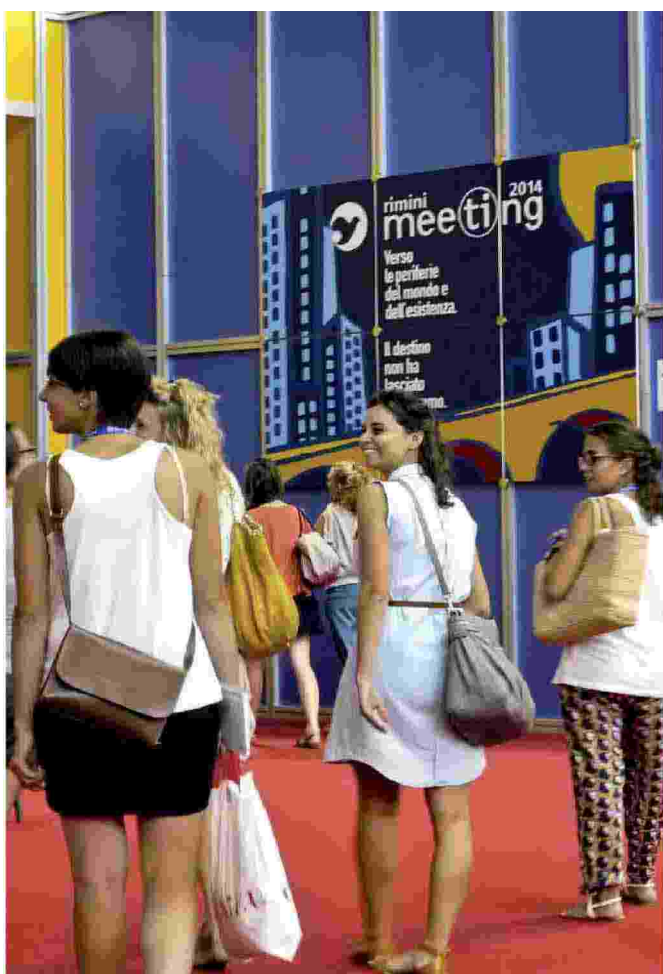
Volontari in arrivo alla Fiera di Rimini dove oggi comincia il Meeting