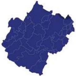
Tabella comuni Cesena