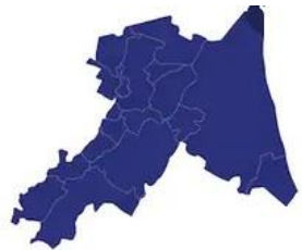
Tabella comuni Ravenna