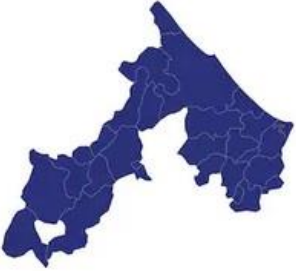
Tabella comuni Rimini